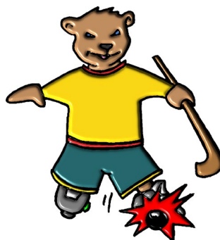
Pas de jeu au pied