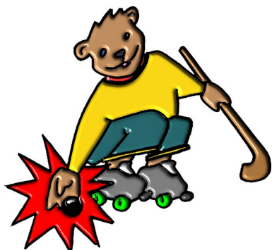
Pas de jeu à la main