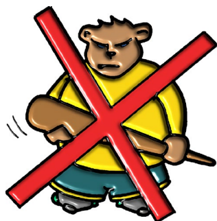
Pas de jeu dur