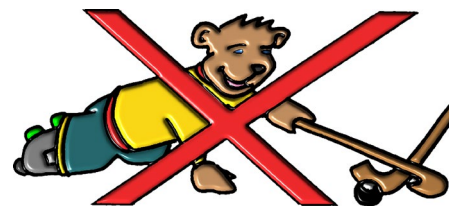
Pas de jeu au sol